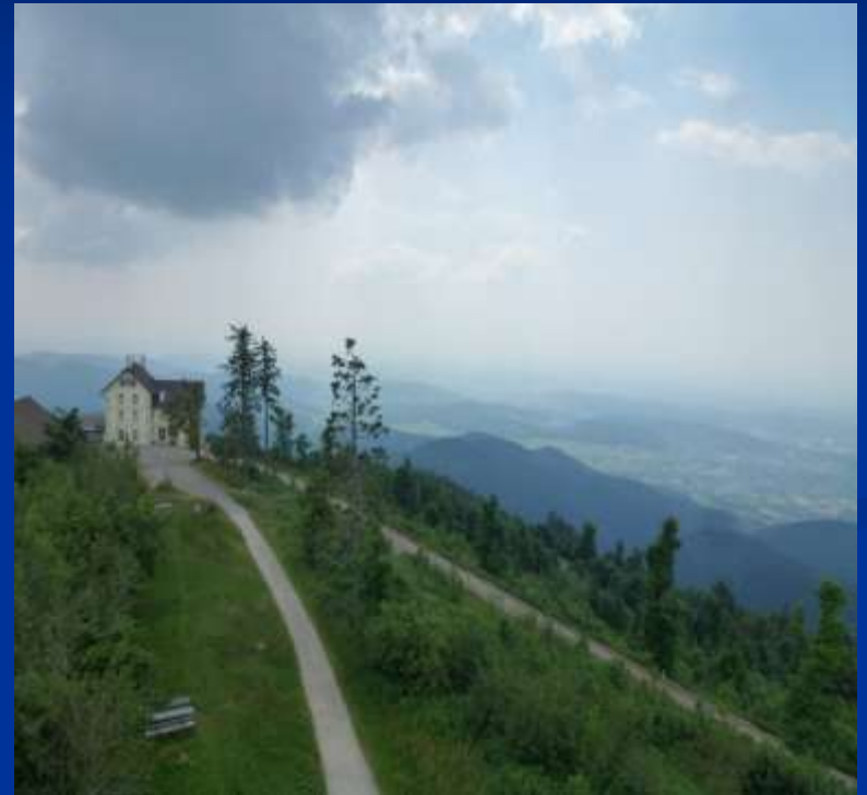
Der Blick vom Blauen