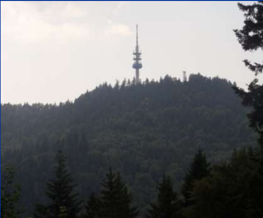
Der Blauen von unten

Wir sind als erste Trekkingklasse über den Blauen gewandert und es war sehr anstrengend. Aber den Ausblick war es wert.