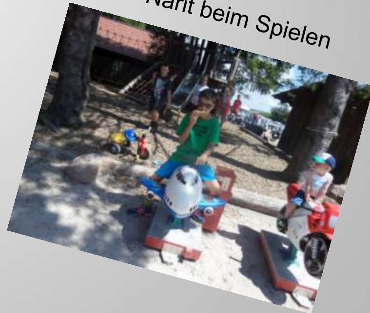
Narit beim Spielen