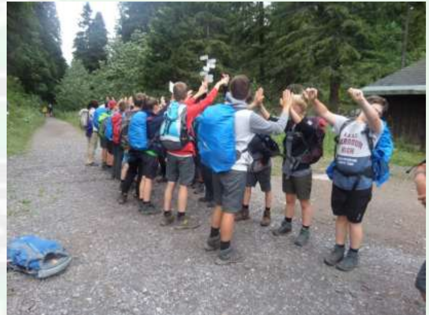
Einlauftr auf dem Feldberg

Etappe 12 Vom Wanderheim Berghäusle zum s'Jägermatt