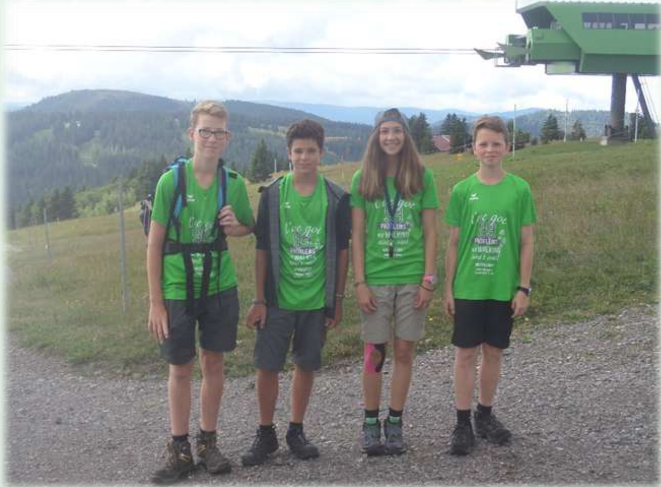
Etappe 13 Vom s'Jägermatt zum Wanderheim Belchenblick