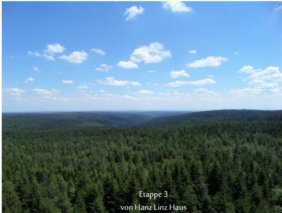
Etappe 3 von Hanz Linz Haus nach Jugendheim Bermersbach

Durchschnittlich war es warm, aber sehr windig. Zu Beginn der Tour war es angenehm kühl unter den Bäumen. Dann liefen wir eine Zeit und die Sonne knallte auf uns hinab.