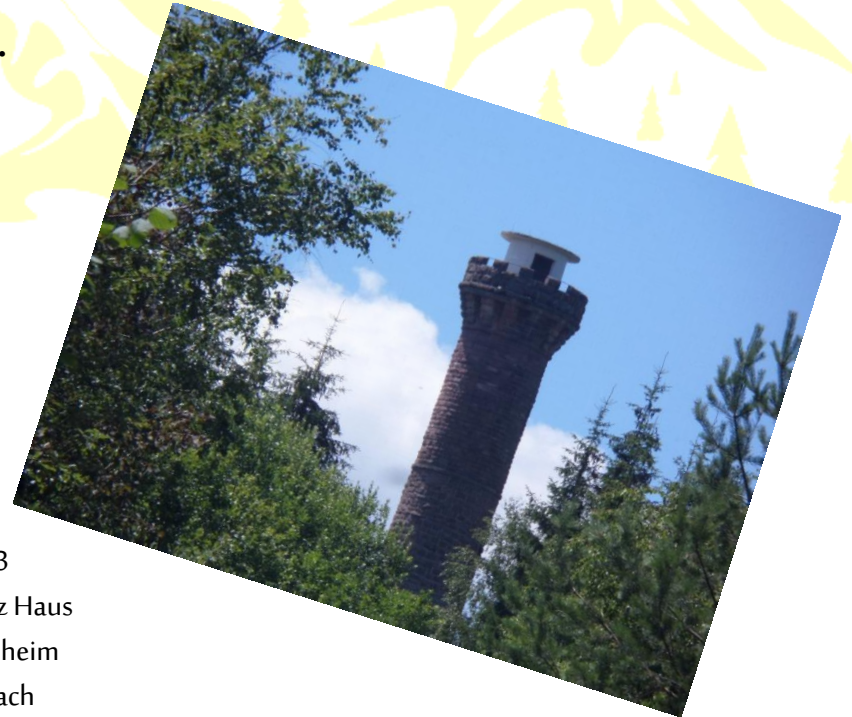
Etappe 3 von Hanz Linz Haus nach Jugendheim Bermersbach