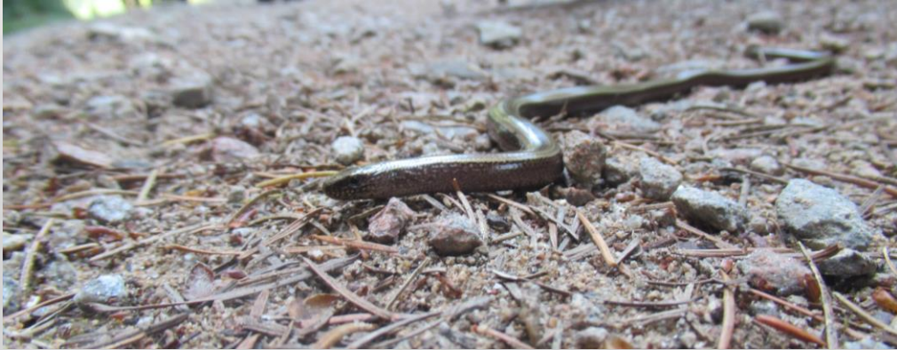
Eine Blindschleiche (Scar)