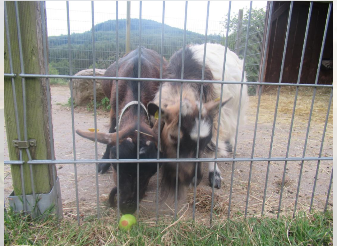
Die Ziegen (Lola und Lilly)