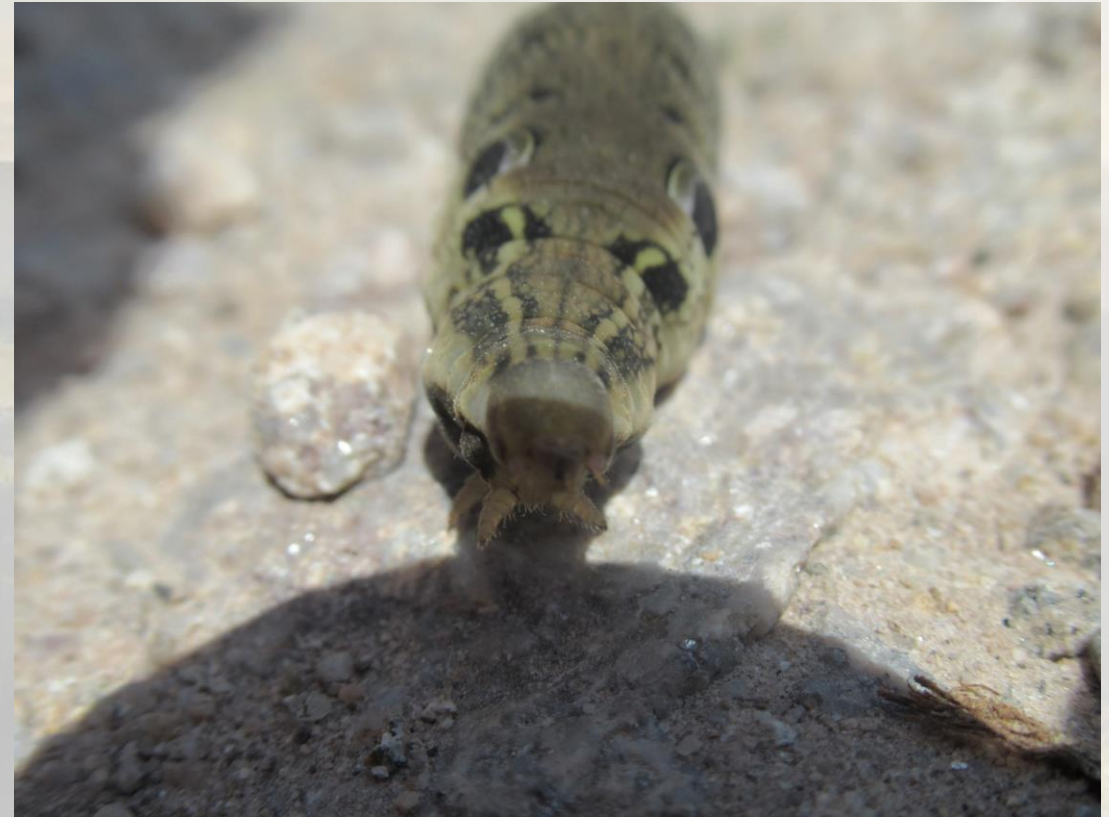
Das ist eine Eruca (Raupe)