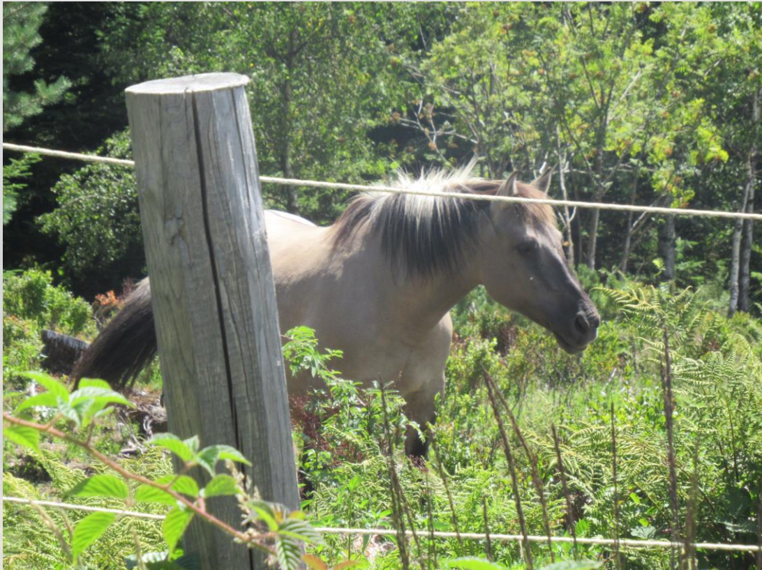
Das ist ein Equus caballus (Pferd)