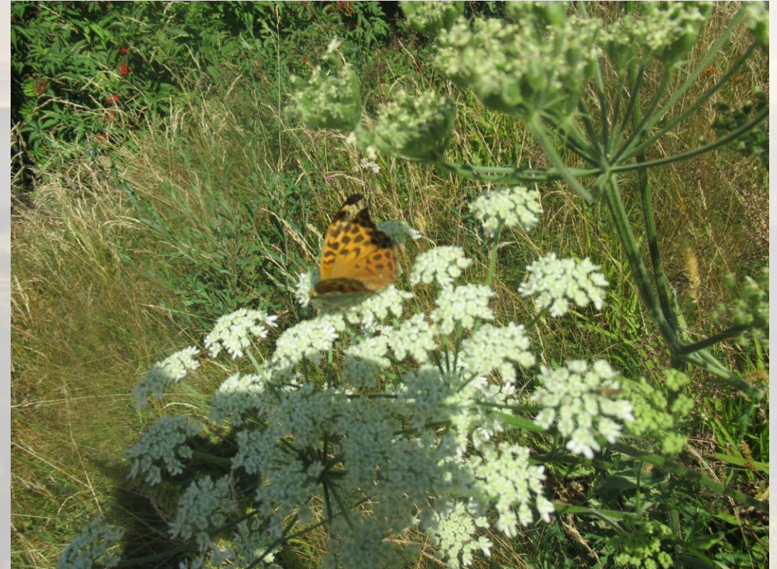
Ein Schmetterling (Otto)