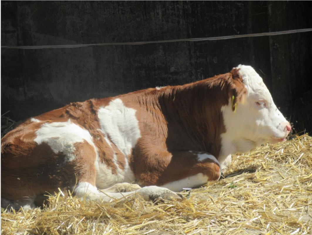
Eine Kuh (Paula)