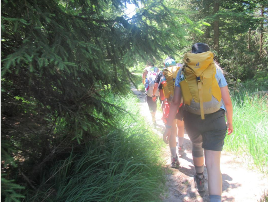
Kurz vor dem Glaswaldsee.

Nach ca. 10 km haben wir den Glaswaldsee erreicht.