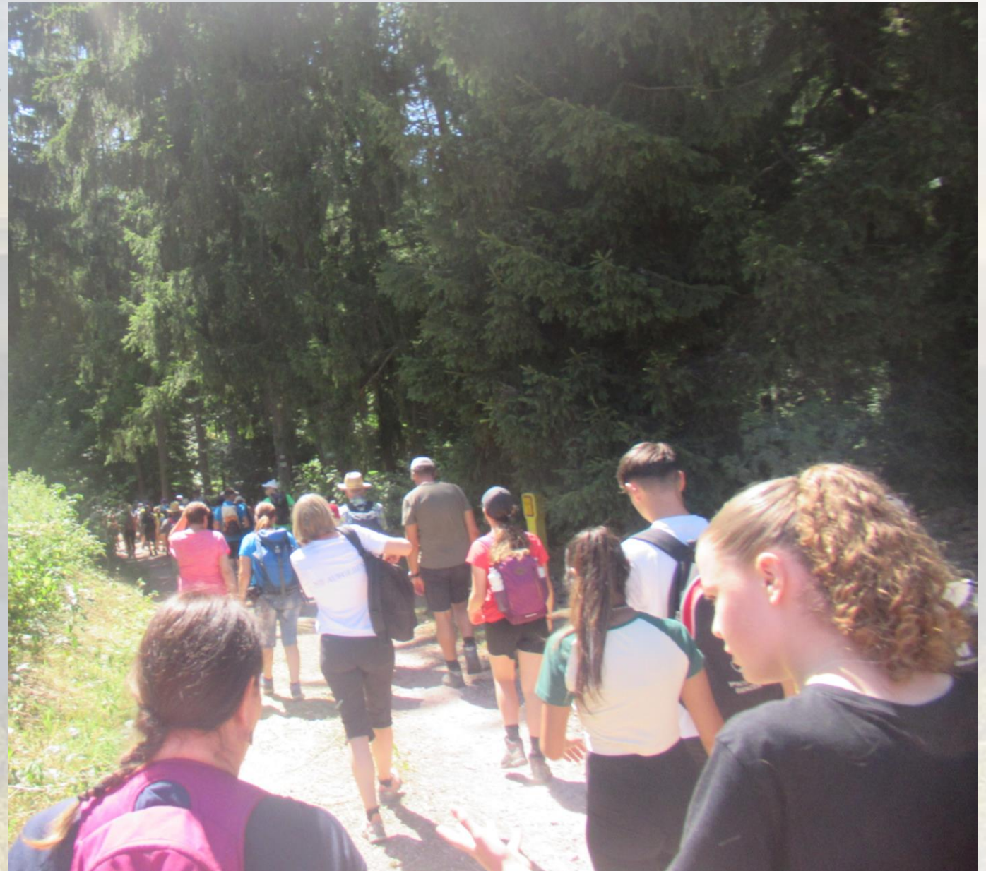
15. Trekkingklasse der Realschule Donaueschingen