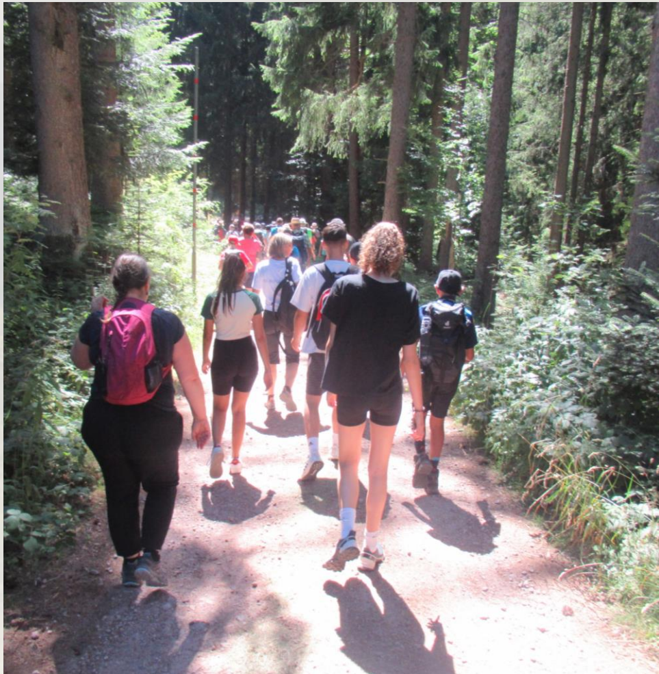
Sonntag, 17. Juli 2022