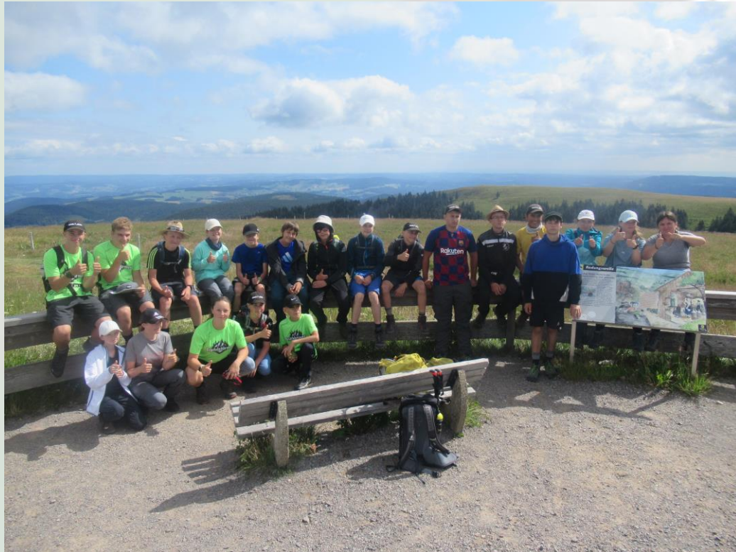
Früh am Morgen auf dem Feldberg Gipfel.