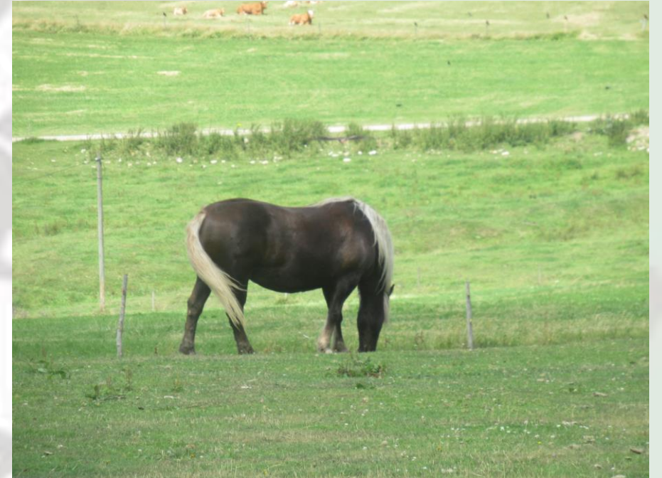
Und das ist Bettina.