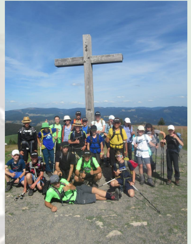
Am Gipfel-Kreuz vom Belchen.