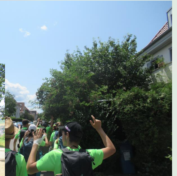
Trekkingklasse 17 der Realschule Donaueschingen