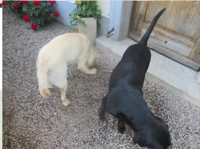
Die Hunde Bailey und Lucy