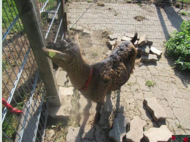
Die Ziege Lola