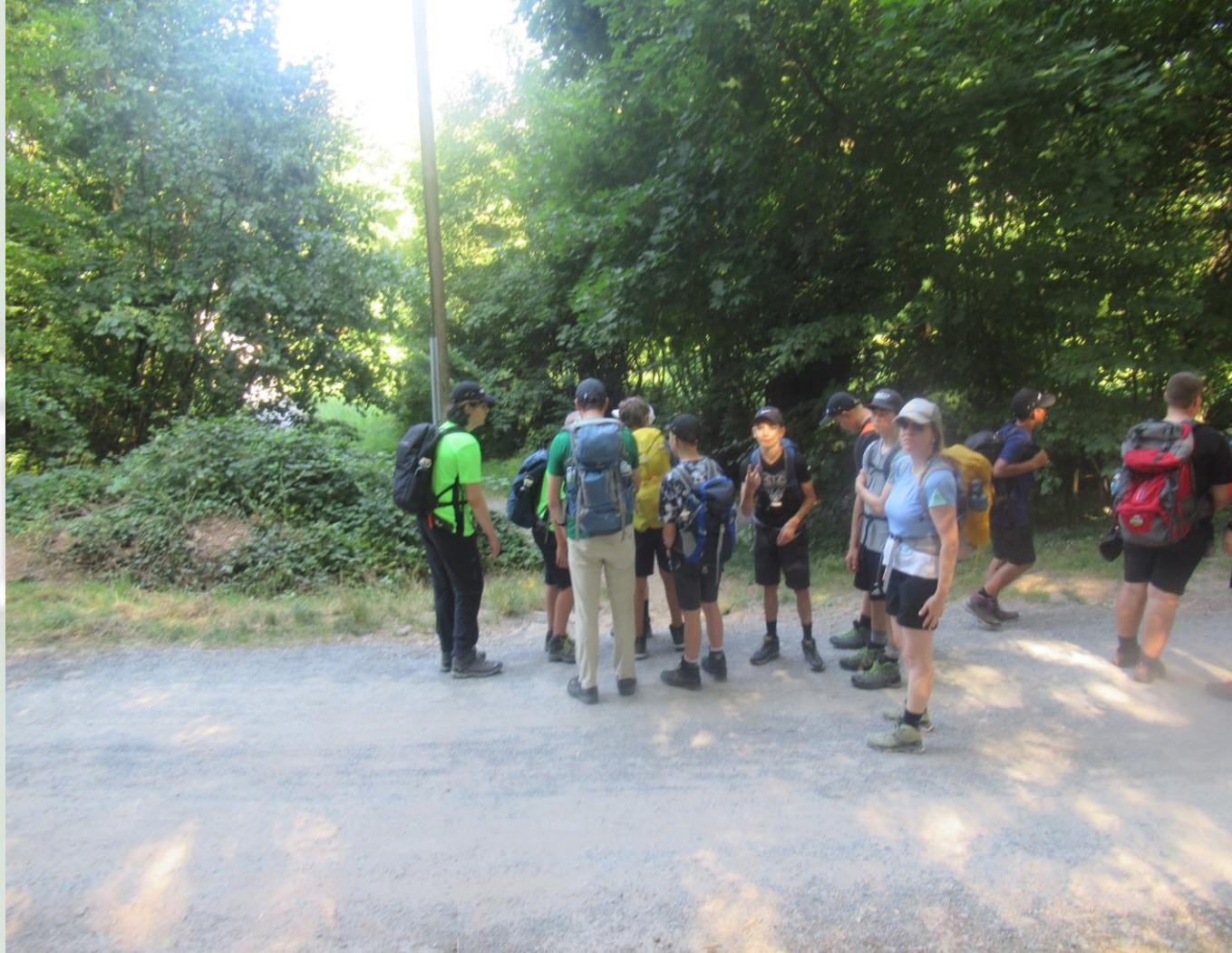
17. Trekkingklasse der Realschule Donaueschingen