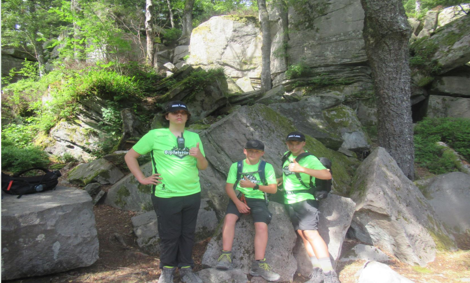
17. Trekkingklasse der Realschule Donaueschingen