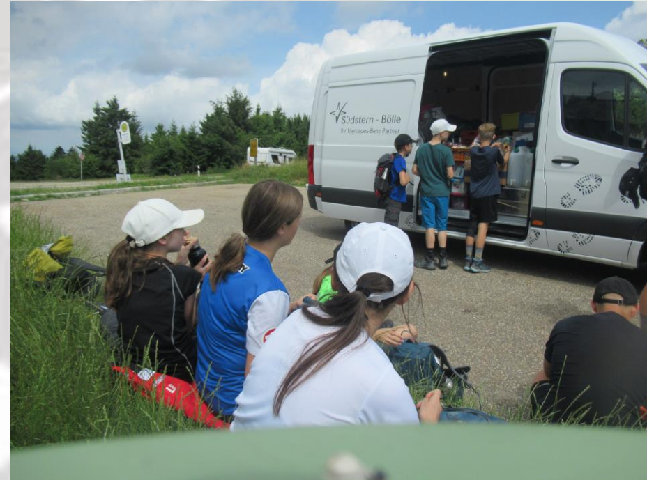
Der Sprinter von Südsterne Bülle hat uns mit leckeren Snacks versorgt