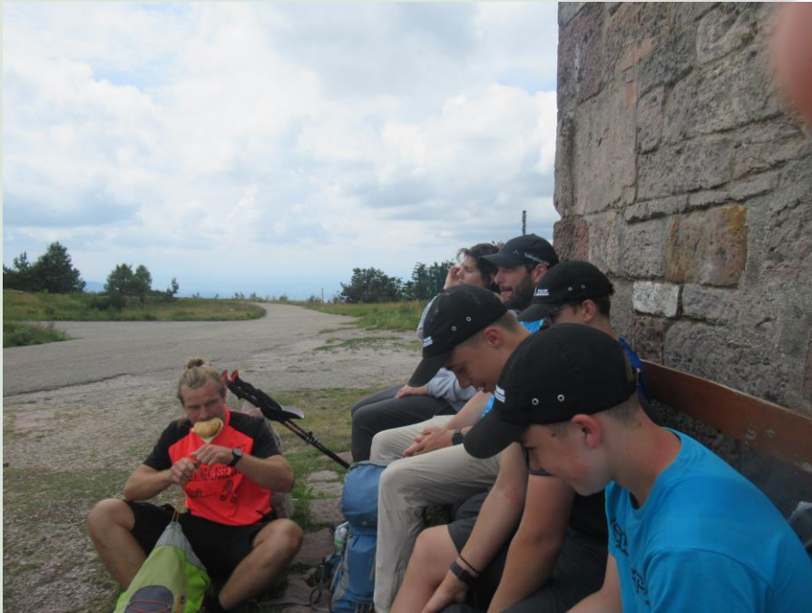
Vesperpause am Hornisgrindeturm