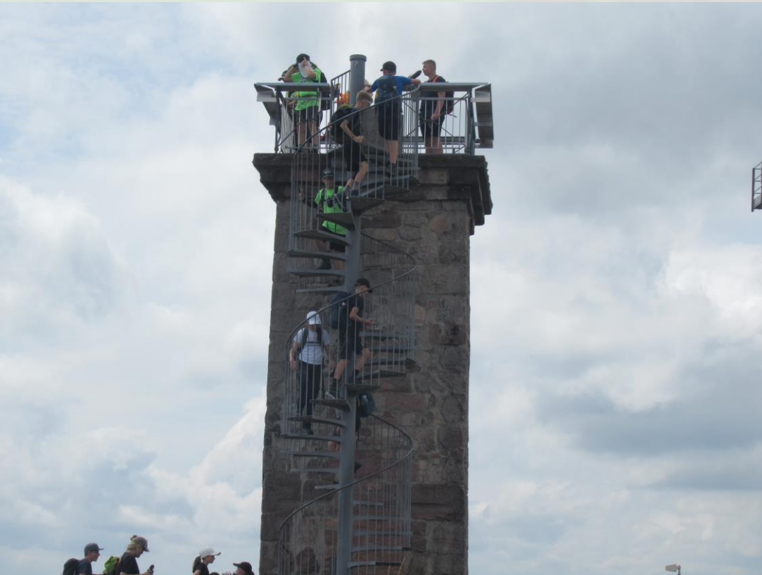
Der Hornisgrindeturm ist oberhalb des Mummelsees und 23 m hoch. Er wurde 1910 erbaut.