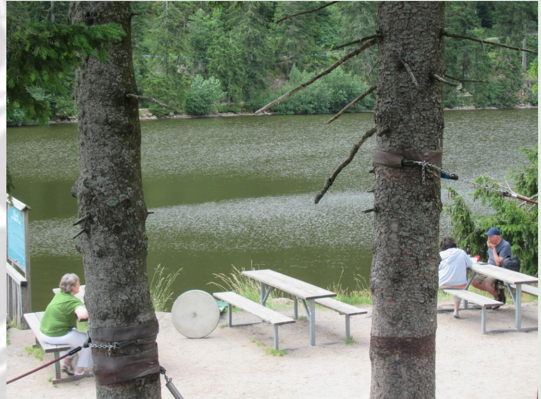
Das ist der Mummelsee. Die maximale Tiefe ist 18m, die Fläche ist 4 Ha.