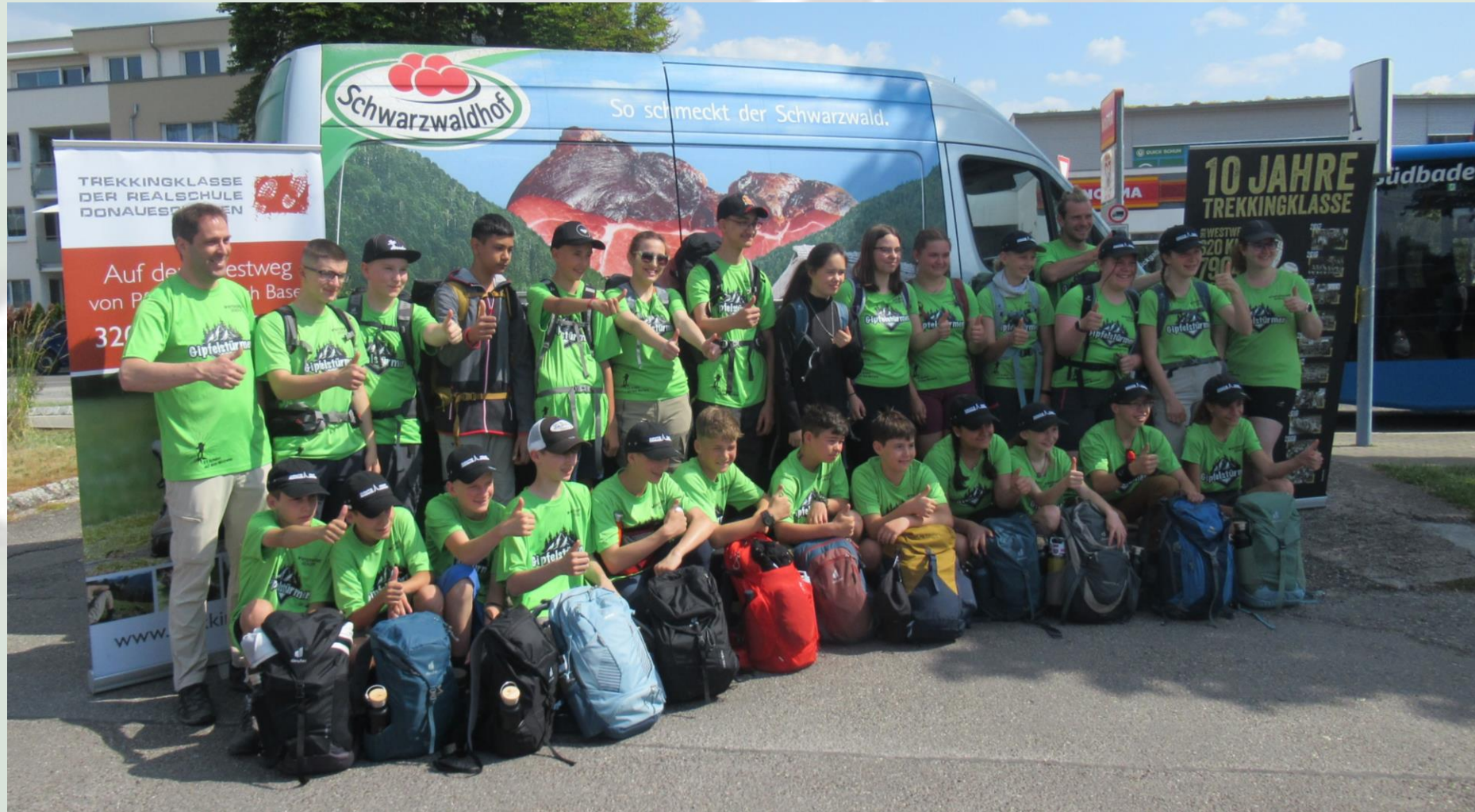
16. Trekkingklasse der Realschule Donaueschingen