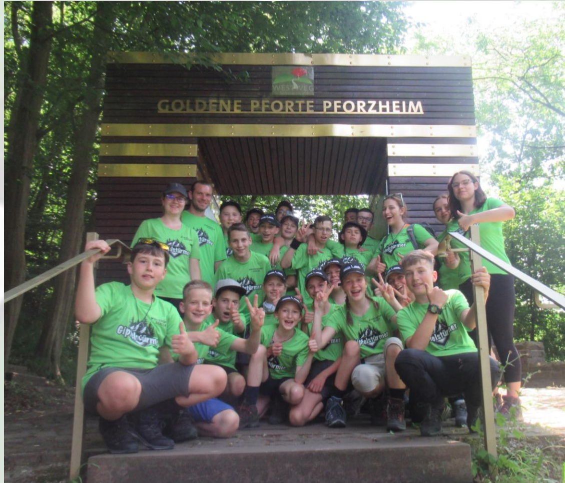
16. Trekkingklasse der Realschule Donaueschingen