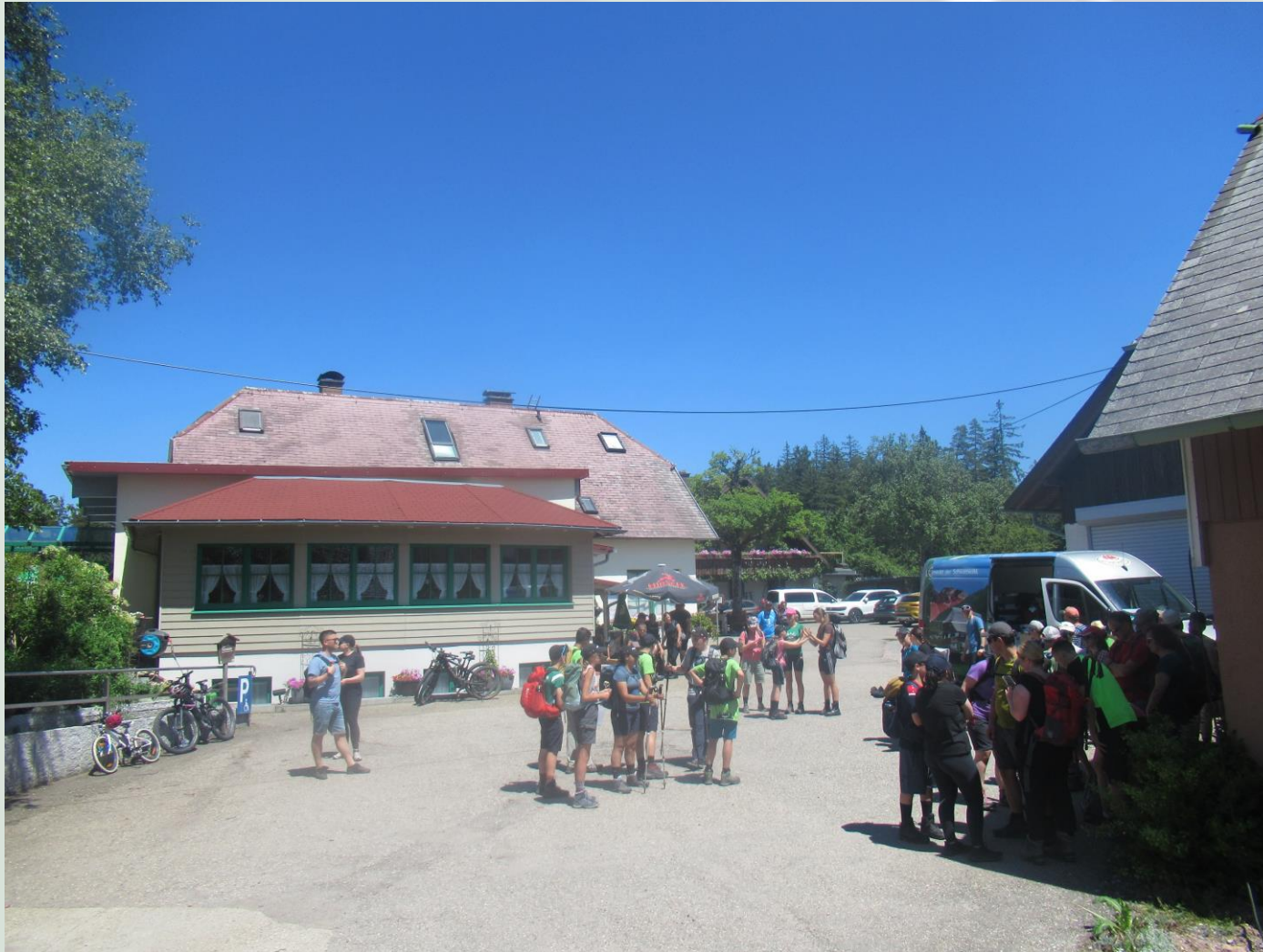
16. Trekkingklasse der Realschule Donaueschingen

Die Eltern haben uns für 10 km begleitet.