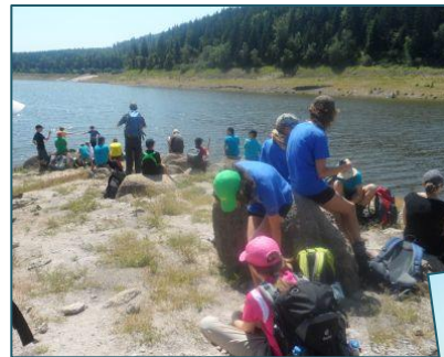
Schwarzenbach- talsperre mit Staumauer