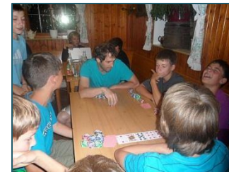
Spielabend. Wer gewinnt wohl?

Etappe 4: Von Bermersbach nach Badener Höhe – 15 km (Gesamt: 76 km)