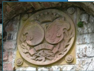
Friedrichsturm mit Wappen und Tafel