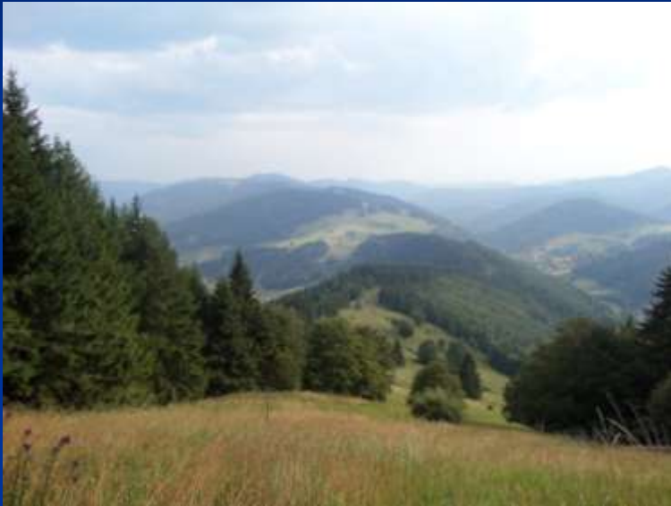
Aussicht vom Belchen

Um zu unserer Unterkunft zu gelangen mussten wir den ganzen Belchen wieder herunter laufen. Dort wurden wir schon sehnsüchtig von einer Gruppe netter Senioren erwartet. Seit mehreren Jahren planen sie ihren Ausflug zeitgleich mit der Trekkingklasse. Darüber freuen wir uns sehr. Dann wurde das Abendessen mit einem Tischgebet eröffnet und sie haben uns angeboten, die Tische für uns abzuräumen und das Geschirr zu spülen.