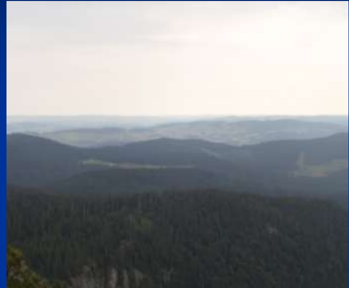
Aussicht vom Feldberg