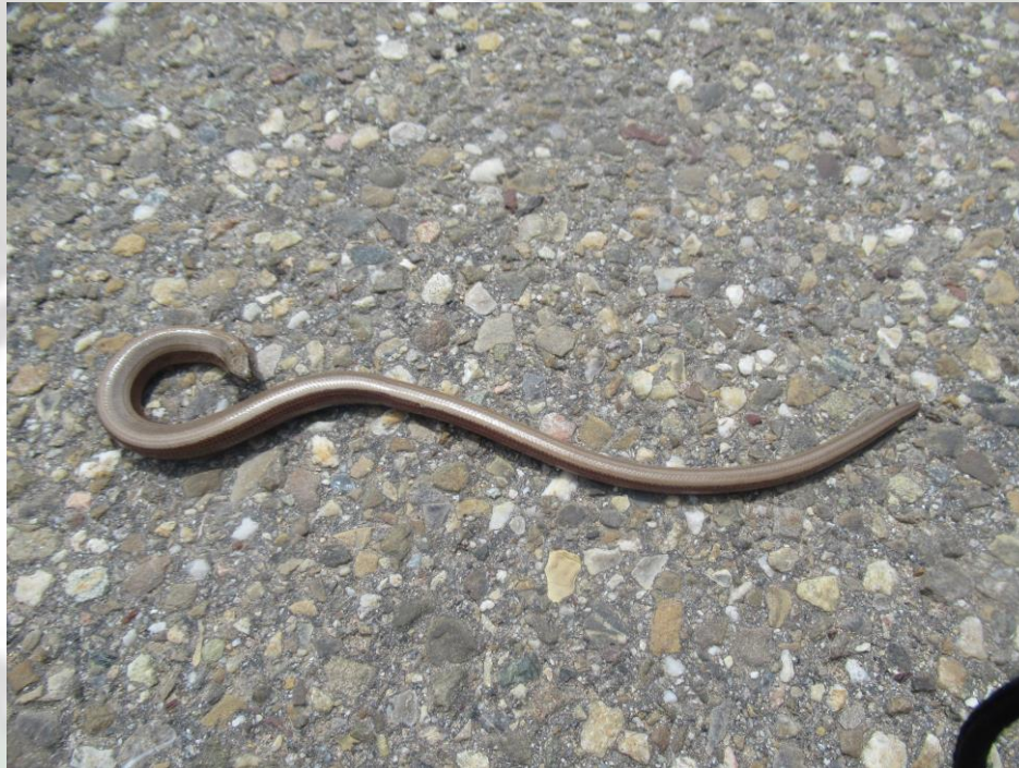
Die Blindschleiche: „Patrischa“