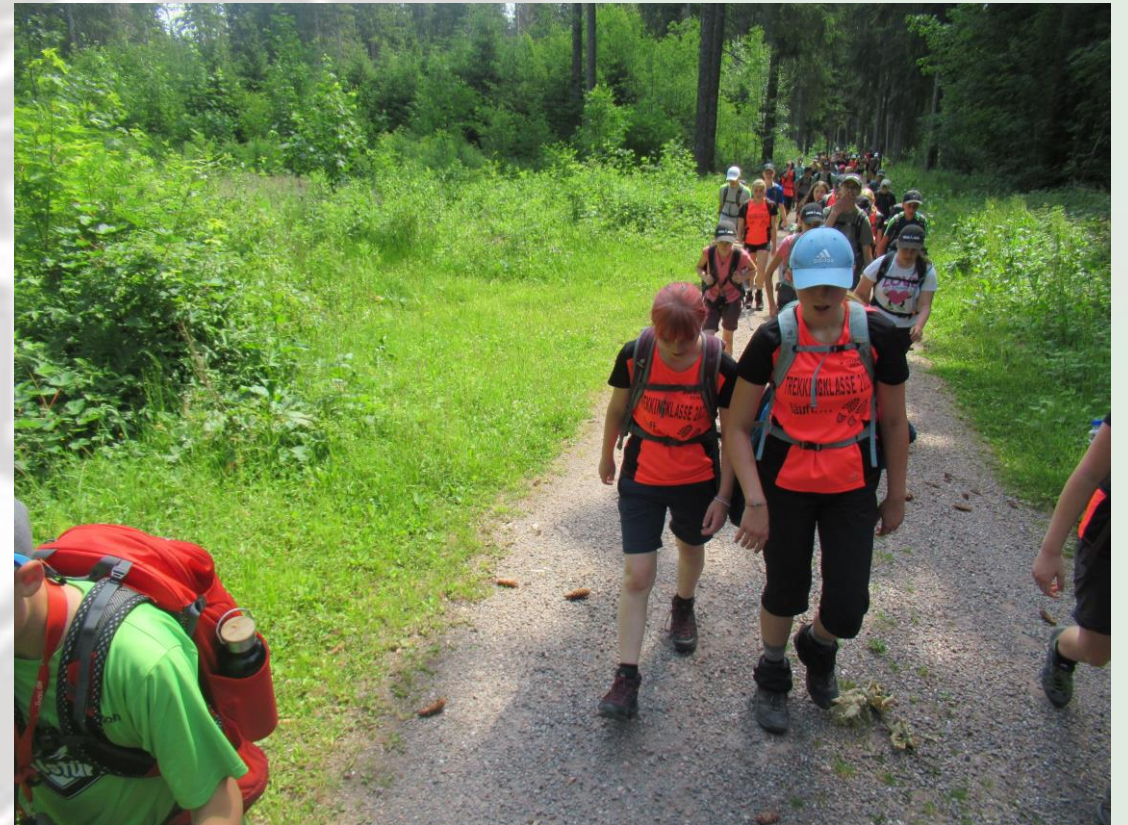
16. Trekkingklasse der Realschule Donaueschingen