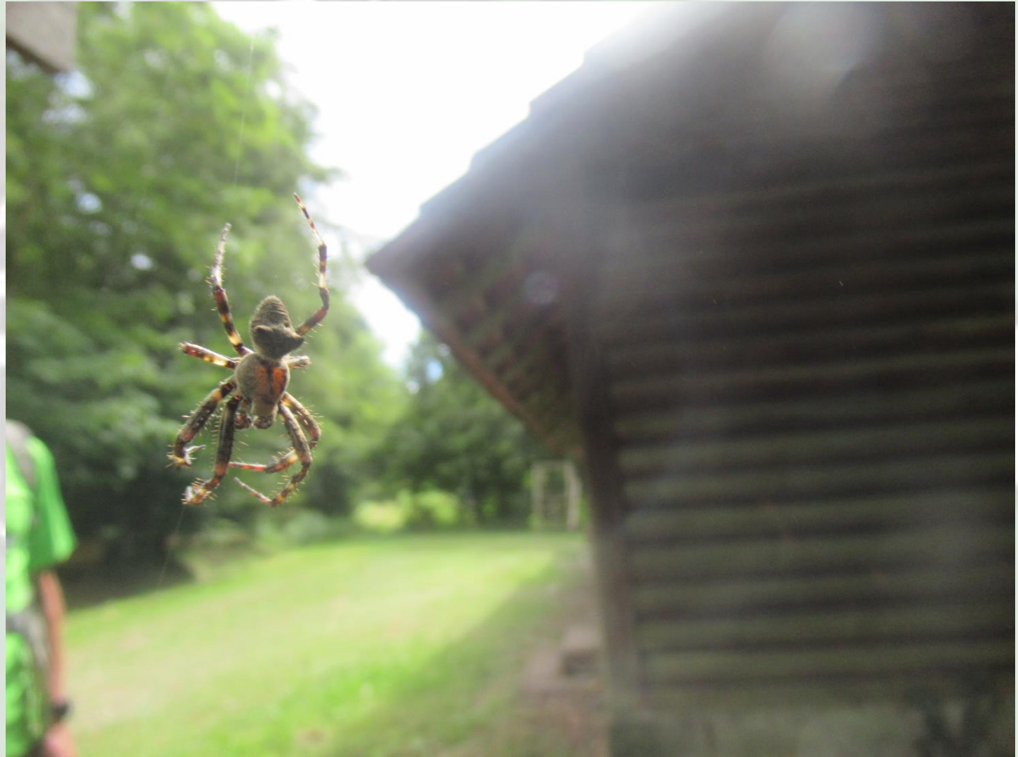
16. Trekkingklasse der Realschule Donaueschingen