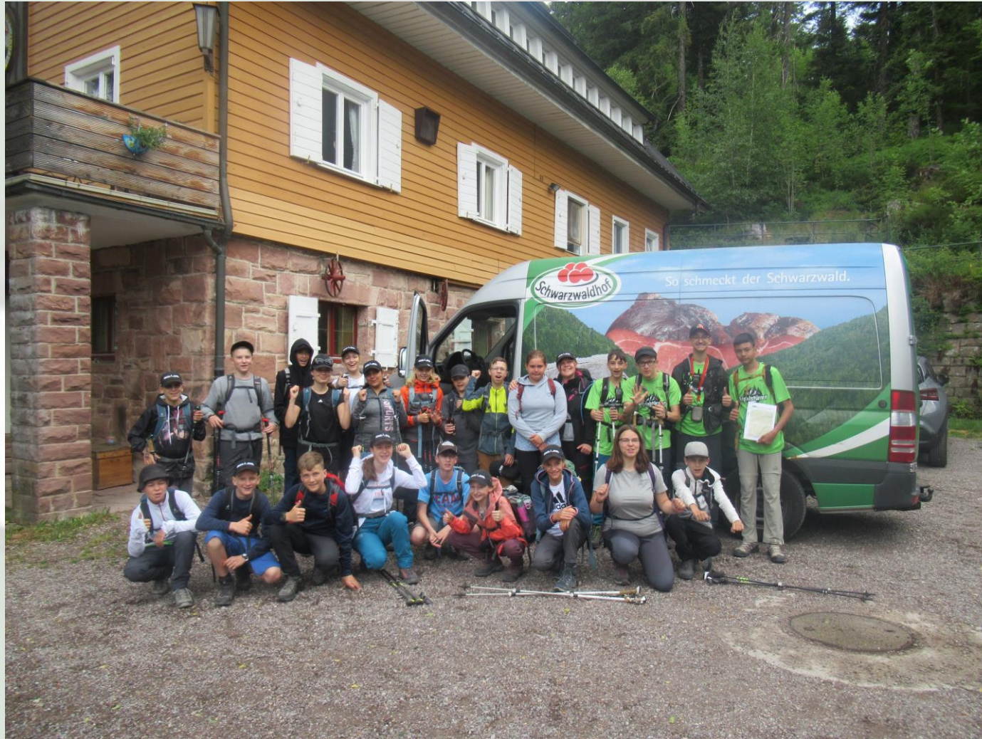
16. Trekkingklasse der Realschule Donaueschingen