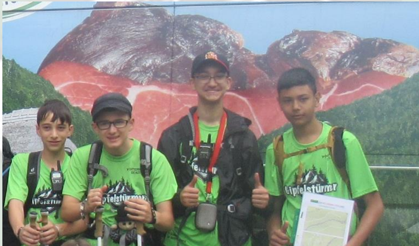
16. Trekkingklasse der Realschule Donaueschingen